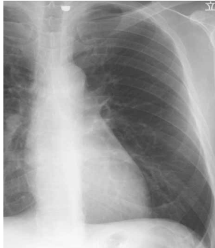
レントゲンでは正常に見えても・・・

胸部レントゲン検査では肋骨 鎖骨 心臓などの後ろに重なっている病変や、小さな病変を発見することは困難な場合があります。マルチスライスヘリカルCTは、体の輪切りの写真を薄く撮影しますので、レントゲンでは見つかりにくい微細な肺がん等も発見できることがあります。